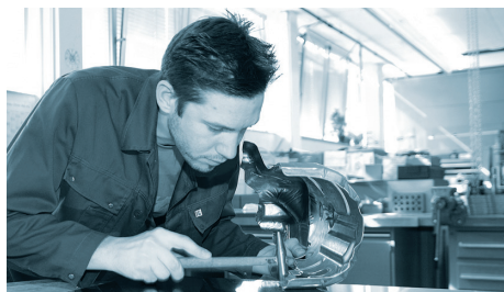
内部工艺能力提供快速样件