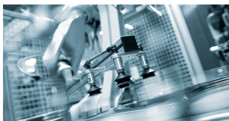
高度自动化的生产线使时间和成本最小化