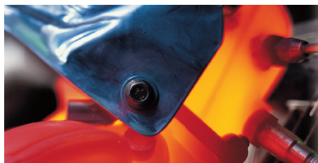
德纳隔热罩为恶劣的工作环境提供保护